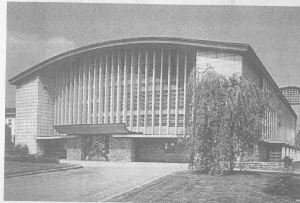
Eglise Notre-Dame au Cierge à Epinal