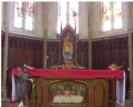
Saint-Louis, placé derrière l'autel.

La cotisation annuelle est de 12 euros. Il est possible d'adhérer à l'association dès maintenant.